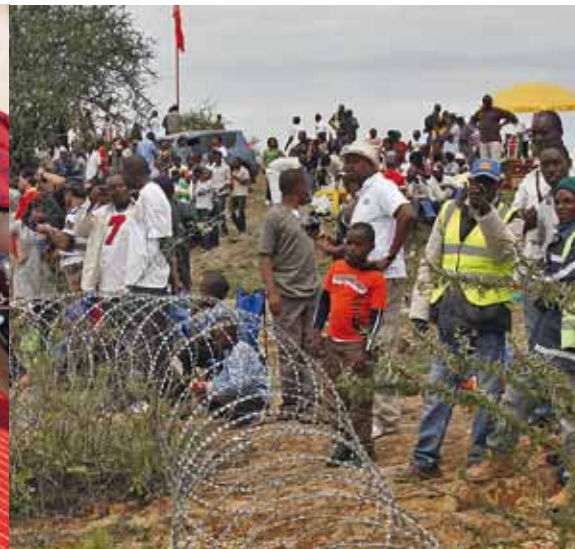
Kein Gefängnis, nur die strikte Zuschauerkontrolle auf der Spectator-Stage

Es ist nicht einmal ein halbes Jahr her, als Schreckensnachrichten aus Kenia auch hierzulande die Tageszeitungen füllten. Eine Dürreperiode und die folgende Hungersnot sind zum Glück nicht nur aus den Medien verschwunden – Petrus leistete seinen Beitrag zur Krisenbewältigung und spendierte der Region eine intensive Regenzeit. Die Savannen erstrahlten so grün wie schon lange nicht mehr und sonst trockene Seen wurden wieder zu Anlaufstellen von durstigen Löwen, Zebras und Elefanten.