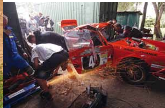
Notoperation: Reparatur am Waldegård-Porsche

Björns Sieg hing am seidenen Faden oder besser gesagt: am Porsche des Schweizer Thomas Flohr. Der hatte am Ruhetag nach einem Überschlag aufgegeben, sein 911er wurde aber weiter mitgeschleppt – und diente jetzt als rollendes Ersatzteillager für sein Schwesterauto. Die Scheiben wurden getauscht und die nötigen Käfigstreben herausgeflext und ins Waldegård-Auto geschweißt. Der Technische Kommissar Karl-Heinz Goldstein verfolgte das hektische Treiben aus dem Hintergrund und zeigte schließlich mit dem Daumen nach oben.